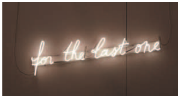
for the last one, 2008, courtesy of hoet bekaert gallery and the artist © Mekhitar Garabedian

Mekhitar Garabedian stelt in zijn werk existentiële vragen rond migratie en verschuivingen in culturele context en betekenis.