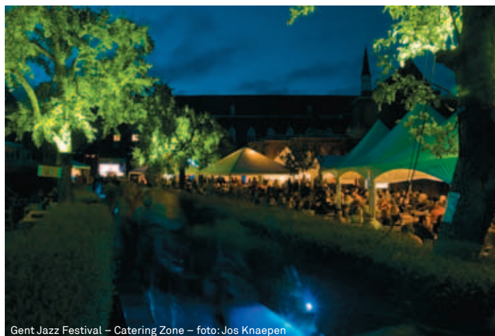
Gent Jazz Festival – Catering Zone