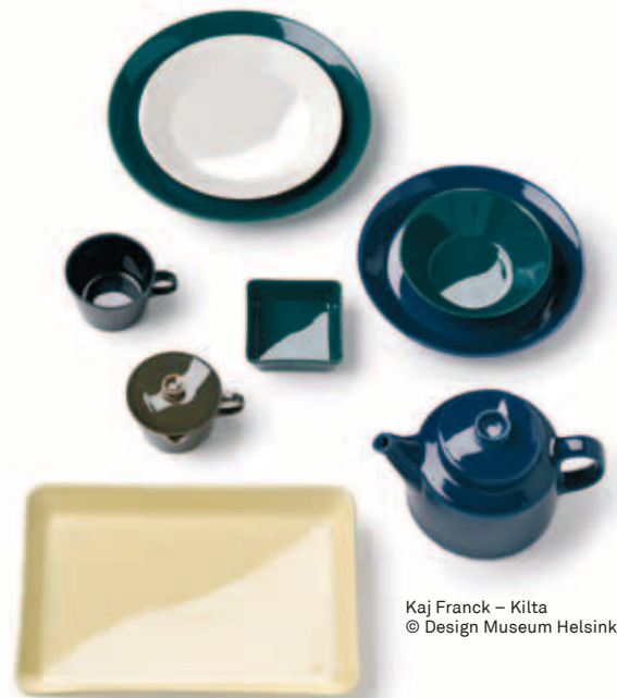
Kaj Franck – Kilta © Design Museum Helsinki