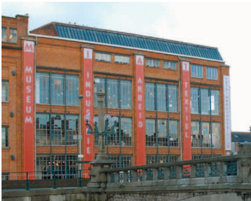
Voorgevel museumgebouw MIAT, de voormalige katoenspinnerij Desmet-Guéquier