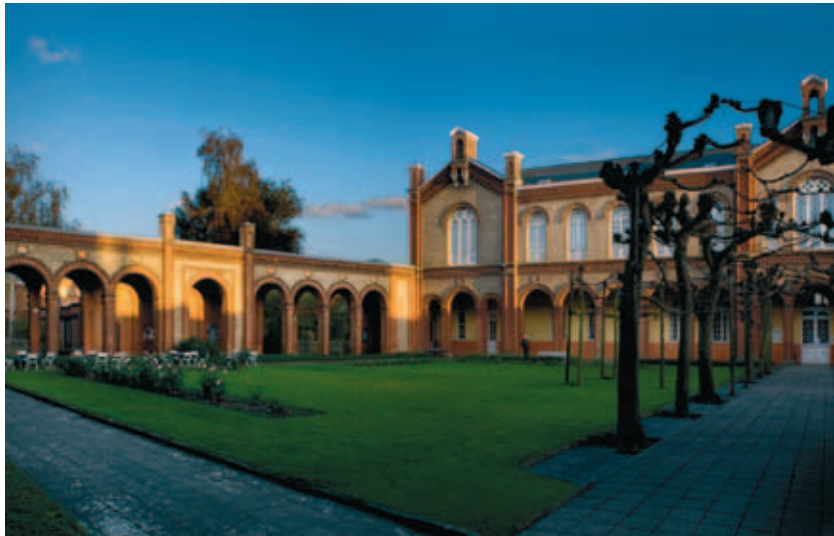
Tuin, Museum Dr. Guislain

In Gent organiseerde dr. Jozef Guislain in de 19de eeuw de moderne psychiatrie. In het oude Hospice Guislain, het eerste Belgische krankzinnigengedeehuis (1857), is nu het Museum Dr. Guislain gevestigd.