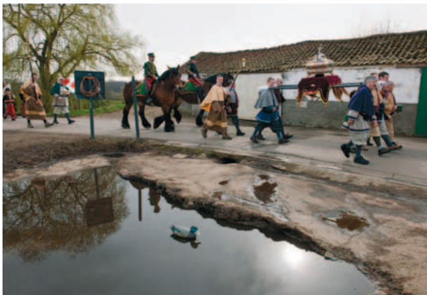
Sint-Veroons- mars Lembeek

Een museum met een passie voor het dagelijks leven in de 20ste eeuw. Ontdek het erfgoed van alledag in voorwerpen, foto's en familiefilms. Ze leggen de tijdsgeest en gewoontes bloot en herinneren aan vervlogen tijden, zelfs van nog niet zo lang geleden. De verhalen over de kleine dingen des levens die (n)ooit voorbijgaan, komen zowel uit het begin van de 20ste eeuw als uit de jaren 50, 60 en 70.