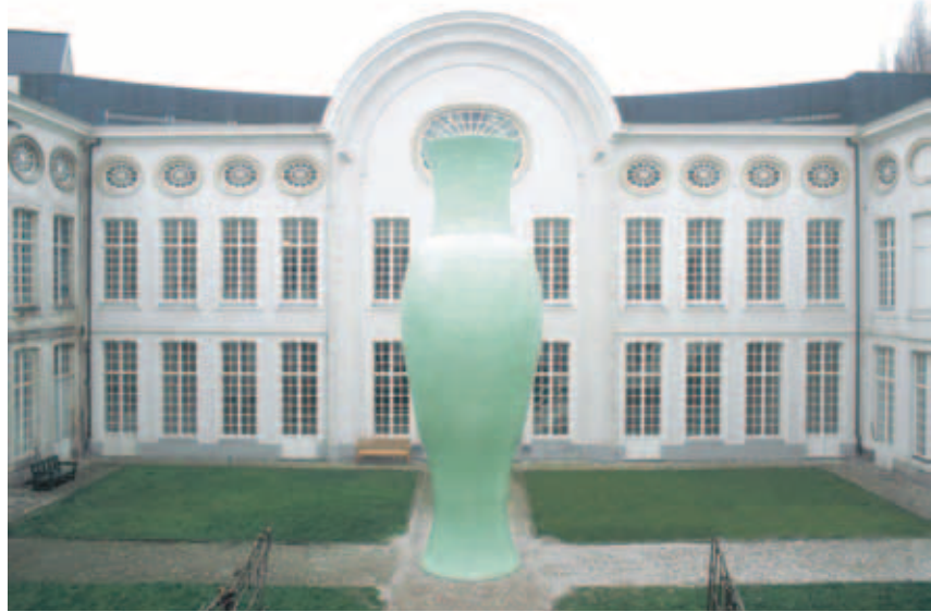
Design museum Gent, binnentuin met vaas Andrea Branzi

Gent is uniek in Vlaanderen. Een intrigerende designcollectie wordt er gepresenteerd in een modern, licht en ruim gebouw. De art-nouveaocollectie omvat meubilair, vazen en gebruiksvoorwerpen van vroeg-20ste-eeuwse vormgevers. Er is ook ruimte voor design uit het interbellum en voor moderne en hedendaagse vormgeving. Een motor van Philippe Starck, een pianokrukje van Henry van de Velde, een .03 van Maarten Van Severen,... U komt ogen te kort!