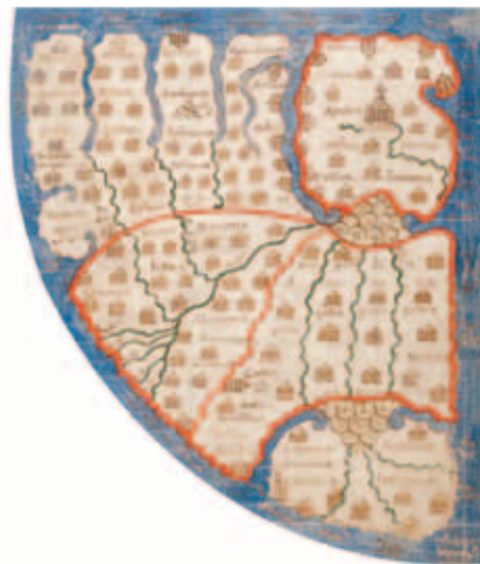
Gent, Universiteitsbibliotheek, Ms. 92, f. 241r: Liber Floridus (1121)

In de ruimtes van de voormalige Bijlokeabdij ontdekt u de geschiedenis van Gent, van de vroegste tijden tot vandaag. De pandgangen verbinden de zalen met elkaar als een tijdslijn. Via multimedia bladert u door het verleden en op zitbanken kunt u luisteren naar verhalen over Gent. Een fotoreeks van Carl De Keyzer toont een eigentijds perspectief op de stad.