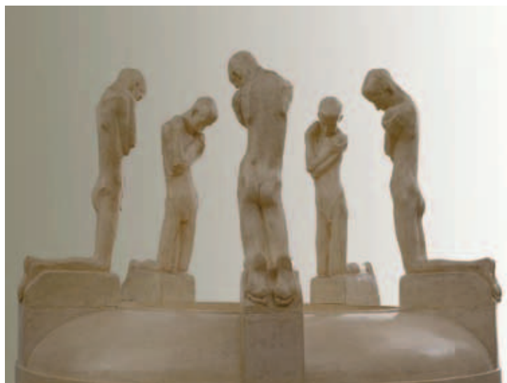
George Minne, De fontein der geknielden, ca. 1905, Museum voor Schone Kunsten, Gent

Deze retrospectieve, samengesteld door de Manchester Art Gallery, brengt alle belangrijke werken van Ford Madox Brown (1821-1893) samen. Brown studeerde aan de academies van Brugge, Gent en Antwerpen en ontpopte zich in Engeland als een pionier van de prerafaëlieten. Deze stroming combineert een traditionele, middeleeuws aandoende stijl met een progressieve visie op mens en maatschappij. In Gent wordt de tentoonstelling aangevuld met werken van Belgische tijdgenoten.