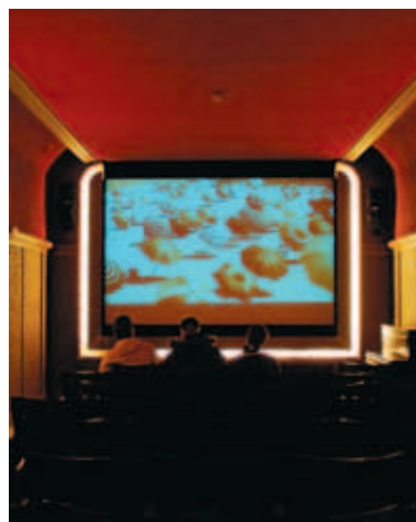
Ciné Palace, het retrofilmzaaltje van het MIAT

Met de expo Futiel textiel? brengt het MIAT het verhaal achter alledaags textiel. Van behang tot vloerbekleding, van little black dress tot hoofddoek, van das tot festivalbandje. Zelfs Siegfried Bracke en Elio Di Rupo werden gestrikt voor deze tentoonstelling. De verrassende betekenissen van textiel doen u versteld staan: van esthetisch tot religieus, van politiek tot erotiek. Futiel textiel? laat geen enkele kant van textiel onberoerd.