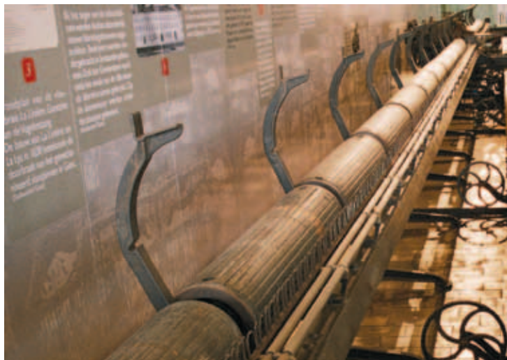
Permanente expo Katoenkabaal

Het MIAT pakt in mei 2012 uit met een project rond bedrijfsvoetbal. Fabrieksploegen waren vroeger hét uithangbord van het bedrijf. Fabrieksvetbal komt overgewaaid uit het Engeland van de 19de eeuw. Bij ons kende het zijn glorieperiode in de jaren 1980. Ga in het MIAT mee op zoek naar de strafste spitsen en de meest memorabele penalty's van toen. Een weinig gekende geschiedenis, die menig voetballiefhebber zal bekoren!