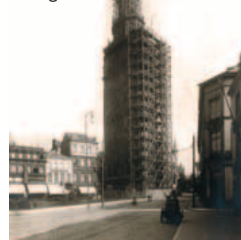
Edmond Sacré, Belfort Gent, 1911 © Stadsarchief Gent

Zijn foto's tonen de grondige transformatie van Gent rond de vorige eeuwwisseling. In het centrum werden huizenblokken gesloopt voor de aanleg van nieuwe straten en pleinen en het vrijmaken van historische monumenten. De stadsrand verloor zijn landelijk karakter door de oprukkende industrialisering.