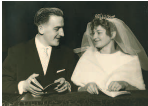
Huwelijk 22 oktober 1960, collectie het Huis van Alijn

In opdracht van Volkskunde Vlaanderen vzw trok fotograaf Nick Hannes een jaar lang in Vlaanderen rond om tradities in beeld te brengen. Dat resulteerde in een actueel beeld van hoe gewoontes en gebruiken vandaag de dag beleefd worden. Soms is dat in intieme familiekring, bij andere viert dan weer een hele gemeenschap mee. Samen tonen de foto's hoe divers Vlaanderen het begrip tradities aan het begin van de 21ste eeuw invult: van auto-wijdingen, carnavalsfeesten, suiker- en offerfeesten, kermiskoersen en gansrijden tot babyborrels en Driekoningenzingen.