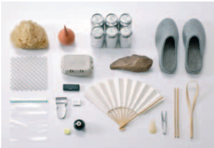
Die Essenz der Dinge – tools of everyday

Een tentoonstelling van Vitra Design Museum Weil am Rhein