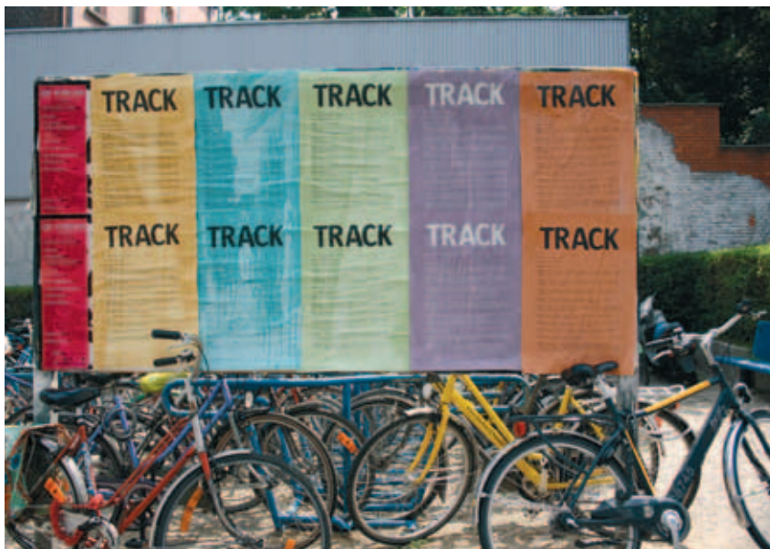
Het TRACK-manifest geafficheerd in de stad Gent.