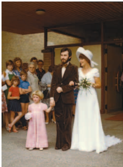
Huwelijk 10 juli 1976

Een van die 'schone dagen' is de huwelijksdag en hét portret van de gehuwden. Over huwelijksfotografie valt veel te vertellen. Het Huis van Alijn licht in deze expo de sluier voor u op.